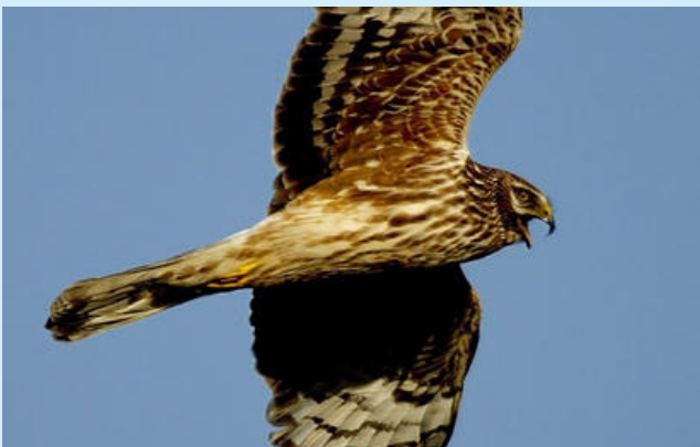
Busard Saint-Martin @Kositoes

Les écologues ont pu observer différentes espèces d'oiseaux lors de leurs sorties, comme le Busard Saint-Martin et le Milan noir, ou encore le Vanneau huppé. Des mesures en faveur de la biodiversité vont être mises en place de la phase de chantier jusqu'à la phase d'exploitation. Par exemple, un dispositif anticollision sera installé sur les éoliennes permettant leur arrêt dès qu'un Milan noir est détecté. Une maîtrise des pratiques agricoles sera également mise en place afin de pérenniser une attractivité limitée des parcelles directement concernées par le projet éolien pour la faune volante.