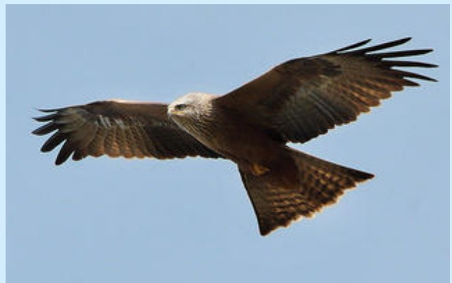
Milan noir @Thomas Kraft