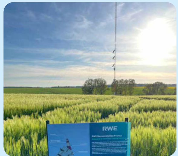
Mât de mesure

Il était équipé de plusieurs types d'instruments de mesures, à différentes hauteurs : des girouettes (direction du vent) et anémomètres (vitesse du vent). Des micros à ultra-sons y ont également été installés durant certaines périodes de l'année, afin de compléter les données de l'étude faune et flore sur l'activité des chauves-souris en altitude.