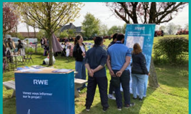
Stand d'information du projet lors de la fête de village en mai 2022

Ces échanges ont permis d'informer et de co-construire plusieurs éléments du projet : nom du parc, photomontages, mesures d'accompagnement (passage au LED, enfouissement de lignes électriques, plantation d'arbres et d'arbustes...). Un site internet et quatre lettres d'information ont également assuré une communication transparente et continue auprès des habitants.